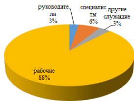
Структура персонала по категориям работников ОАО «МАЗ» – управляющая компания холдинга «БЕЛАВТОМАЗ» в 2023 г., %

5. Численность работников за три года снизилась на 879 чел., составив 15389 чел. На предприятии преобладают кадры с профессионально-техническим образованием в возрасте от 30 до 49 лет. Рабочие занимают 88 % в общей структуре персонала. Износ оборудования составляет 79,9 %. Основную часть составляет оборудование в возрасте от 20-ти лет и свыше.