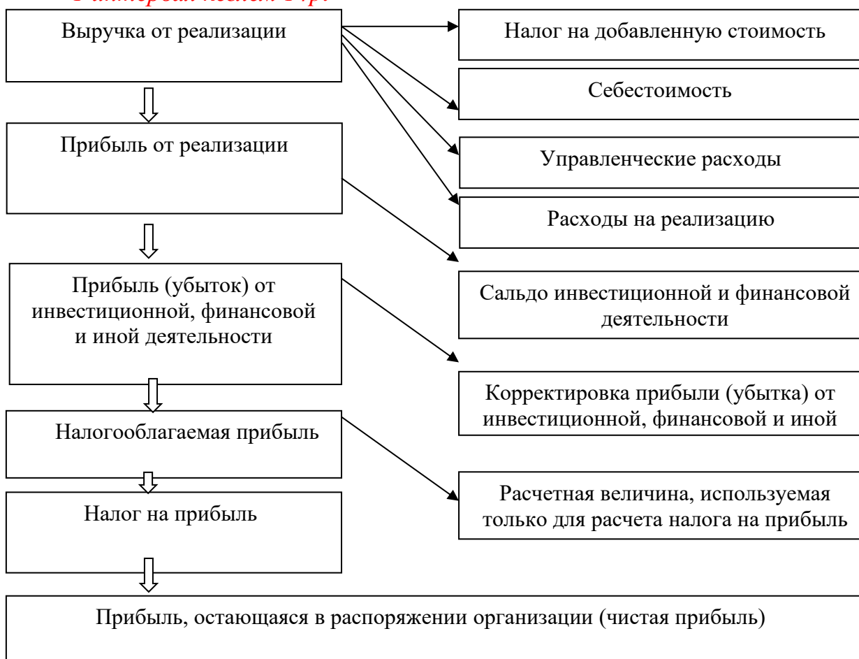
Рисунок 1.2 – Формирование прибыли в организации