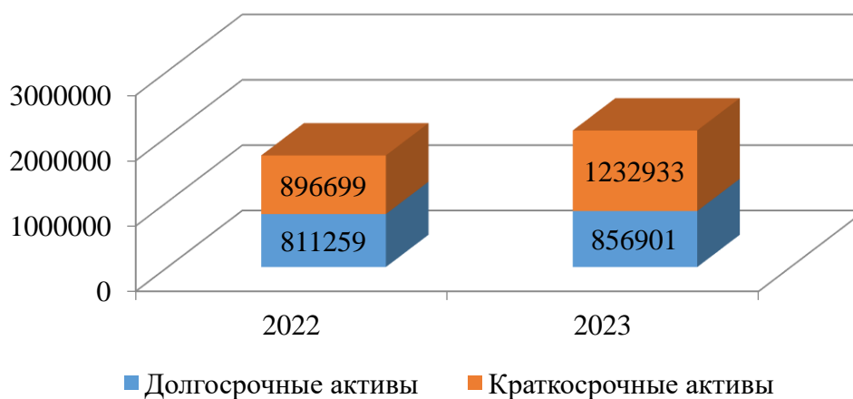
Рисунок 2.3 – Динамика структуры активов баланса ОАО «МАЗ» – управляющая компания холдинга «БЕЛАВТОМАЗ» за 2022-2023 годы, тысяч рублей

Примечание – Источник: собственная разработка на основании данных предприятия